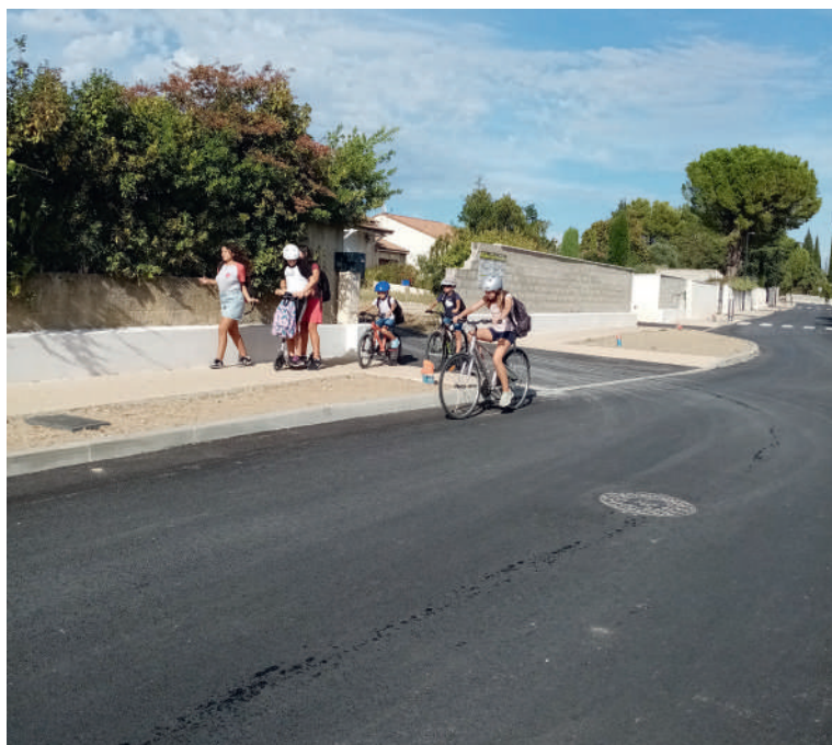
Le Font du Rouve - Après