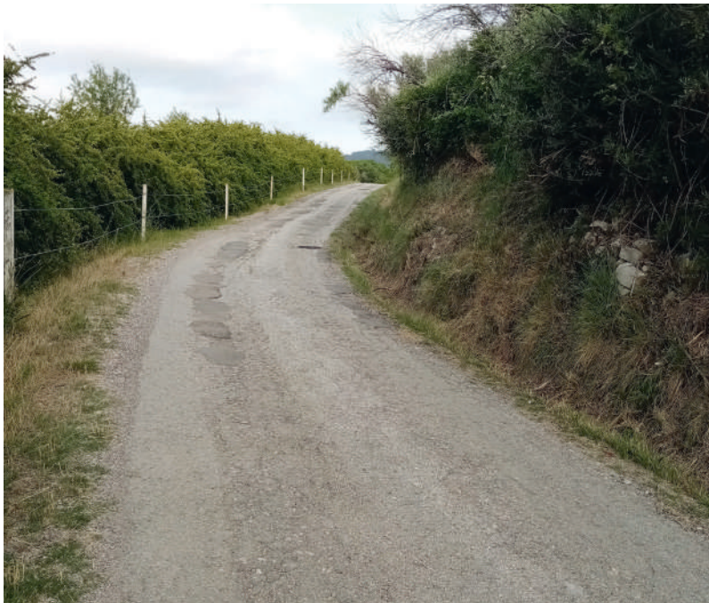
Chemin rural - Avant