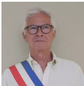
OLIVIER CHAPEL FINANCES