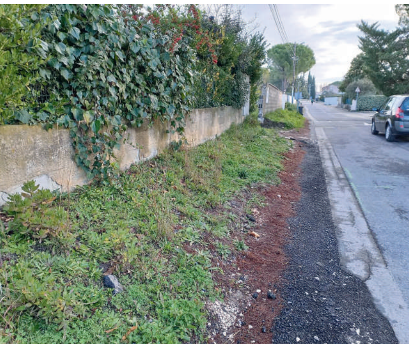
Le Font du Rouve - Avant

En début d'année nous avons pris la décision de l'extinction de l'éclairage public de 23h à 5h30 pour réduire la facture énergétique et de favoriser l'environnement et la biodiversité. Pour accentuer cette réduction, nous avons décidé d'accélérer l'échange de lampadaires en passant de 20 lampadaires par an à 80 pour cette année. Ces points lumineux étaient équipés de lampes au sodium d'une puissance de