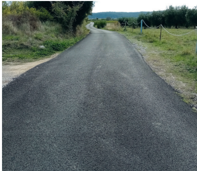
Chemin rural - Après

100 ou 150 watts qui sont remplacées par des lampes LED (20/30 W).